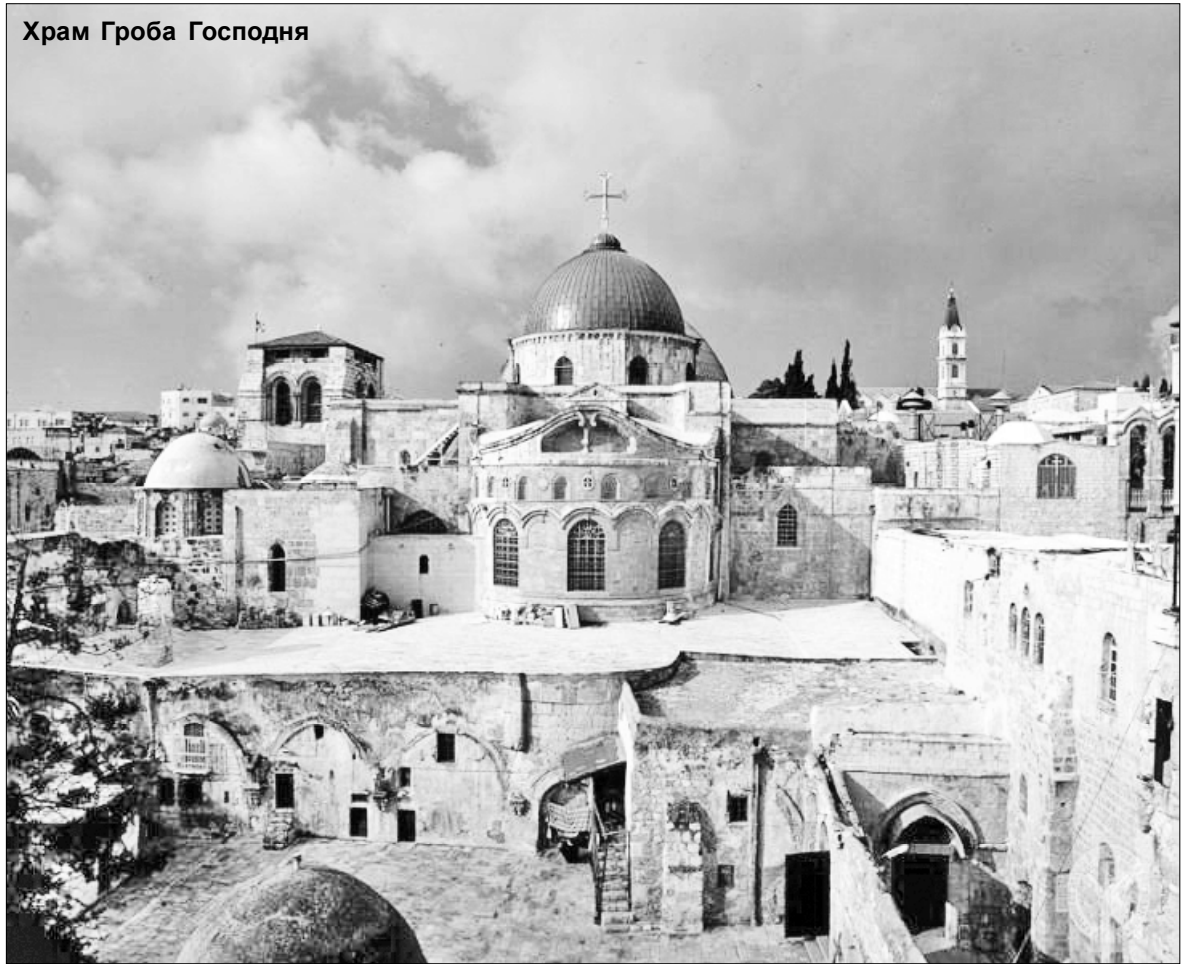
Храм Гроба Господня

Когда выходишь из храма Воскресения, попадаешь на широкую стилизованную улицу с колоннами, на стенах - картины времени жизни Иисуса: вот городская площадь, на которой идёт оживлённая торговля, потому как вокруг рыночных площадей и образовывались города. На них шла торговля овощами и фруктами, многоголосье восточного базара наполнялось голосами животных и птиц, а так как рынок был многолюдным местом встреч, не обходили его стороной и политические ристалища, которые