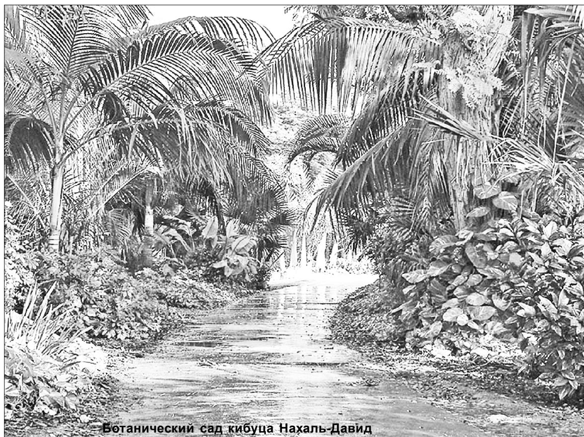
Ботанический сад кибуца Нахаль-Давид

Осмотрели также и место, откуда исходит благодатный огонь. В небольшом помещении в стену встроено отверстие в виде сопла, которое имеет хорошую вентиляцию, так как чувствуется приток свежего воздуха.