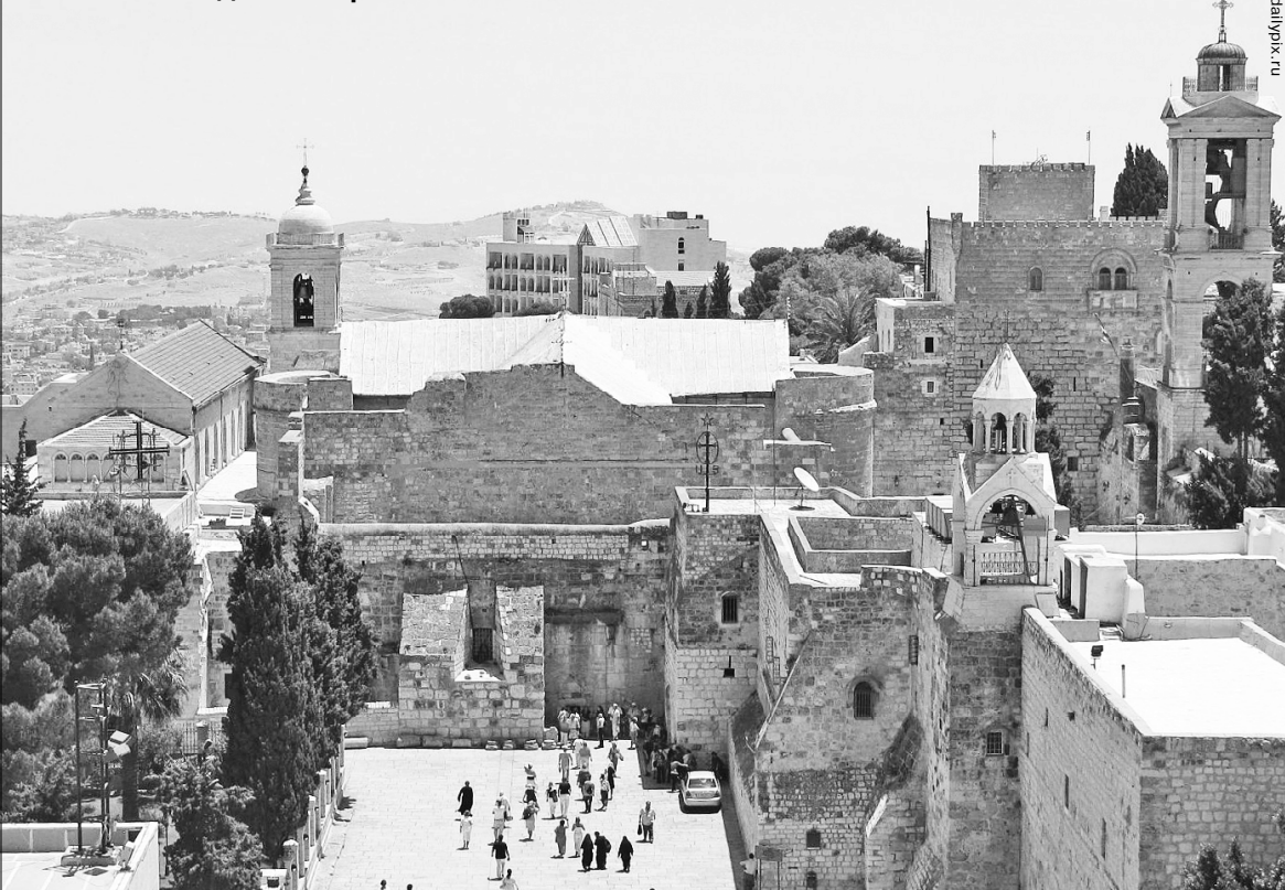
Базилика Рождества Христова

кой вход под алтарём, на каком праве и кому принадлежит сам иконостас, включая право пользования Вифлеемской звездой. Всё расписано - от лампы, до иконы.