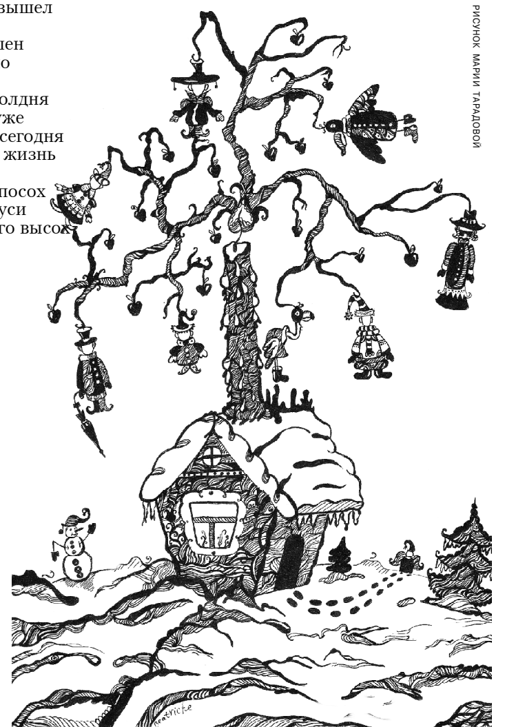
РИСНОК МАРИИ ТАРАКОВОЙ

И это все спасет меня наверное И грезы протрубят - воспоминальное Цветы лесные - тусклое и верное И все вокруг - степное и прощальное